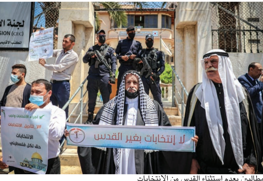
مطالين بعدم استثناء القدس من الانتخابات

رفضاً لتأجيل الانتخابات «كونها حقاً وطنياً وديمقراطياً ودستورياً». واعتبرت هذه القوائم - وأخرى غيرها ومنها «الحرية» الممثلة للقياديين في حركة فتح مروان البرغوثي وناصر القدوة - تأجيل أو عرقلة إجراء الانتخابات التشريعية والرئاسية في مواعيدها المقررة في أيار وأب/ أيلول القادمين «غصباً للسلطة ونيل من حق الفلسطينيين في تقرير مصيرهم». وقالت مذكرة قانونية أعدتها لجنة مختصة تمثل ١٥ قائمة انتخابية إن تأجيل الانتخابات