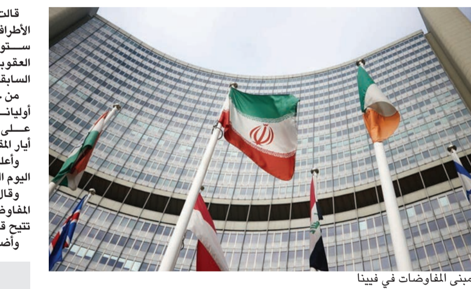
مبنى المفاوضات في فيينا

قالت مصادر دبلوماسية إن مجموعة الخبراء التي شكلتها الأطراف المعنية بالمفاوضات بشأن الاتفاق النووي في فيينا ستواصل عملها بمناقشة القضايا التفصيلية المتعلقة برفع العقوبات الأميركية على إيران وعودة طهران لالتزاماتها السابقة. من جانبه، أعلن ممثل روسيا في مفاوضات فيينا ميخائيل أوليانوف أن الأطراف المشاركة في مفاوضات فيينا اتفقت على العمل بمجهود أكبر لإحياء الاتفاق النووي قبل نهاية أيار المقبل. وأعلنت موسكو أن مسؤولين روساً وأميركيين سيعقدون اليوم الخميس جولة جديدة من المشاورات. وقال أوليانوف إن هناك «كل الدواعي للتفاوض الحذر» إزاء المفاوضات الجارية، لافتاً إلى أن الأمور تتطور بطريقة قد تتيح قريباً حذف كلمة «الحذر» من هذه العبارة. وأضاف الدبلوماسي الروسي أن مسألة رفع العقوبات التي