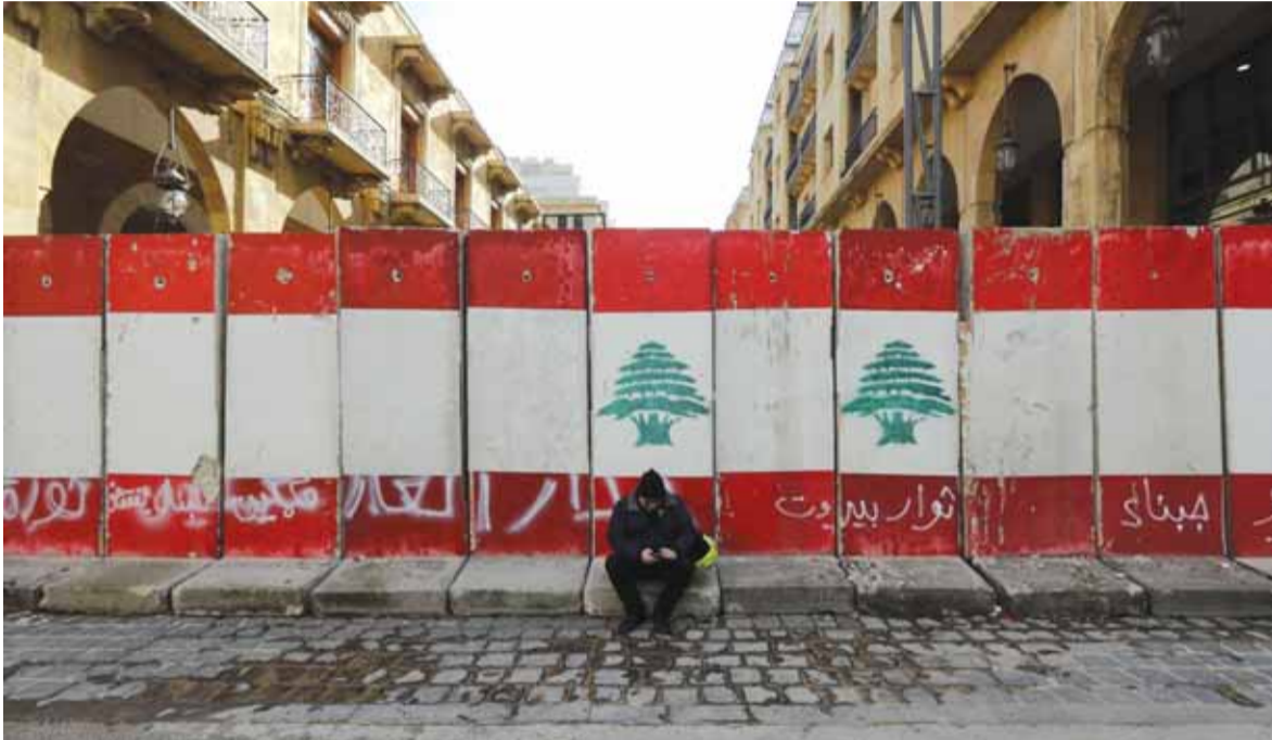
الاجراءات الامنية المشددة بالجدران الاسمنتية أمام مجلس النواب