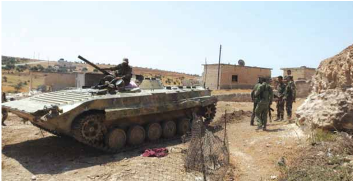
عناصر من الجيش السوري خلال عملية تحرير معرشورين

حقّق الجيش السوري، مساء أمس، تقدما ميدانيا جديدا جنوب منطقة إدلب لخفض التضعيد حيث قطع الطريق الدولي بين معرّة النعمان وسراقب. واقعات وكالة «سانا» السورية الرسمية بأن القوات الحكومية بسطت السيطرة على قرية الدانا شمال مدينة معرّة النعمان، التي تعتبر أكبر معقل لسليحي «هبيكة تحزير الشام» جنوب منطقة إدلب لخفض التضعيد. من جانبه، ذكر مصدر عسكري أن الجيش السوري