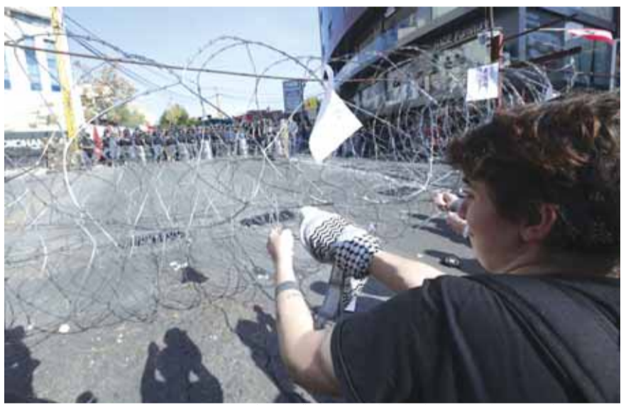
صورة من الارشيف لتظاهرة امام السفارة الاميركية في عوكر

ابراهيم ناصر الدين لم تنه الصواريخ الإيرانية البالستية التي استهدفت قاعدتين عسكريتين للقوات الاميركية في العراق «الحساب» المفتوح مع الولايات المتحدة الاميركية، انها «وجبة» أولى وضعت على «طاولة» الخيارات العسكرية المباشرة من قبل طهران للرد على تجاوز الرئيس الأميركي دونالد ترامب «الخطوط الحمراء»، فكانت اولاً ضربة «للهيبة» (التتمة ص ١٢)