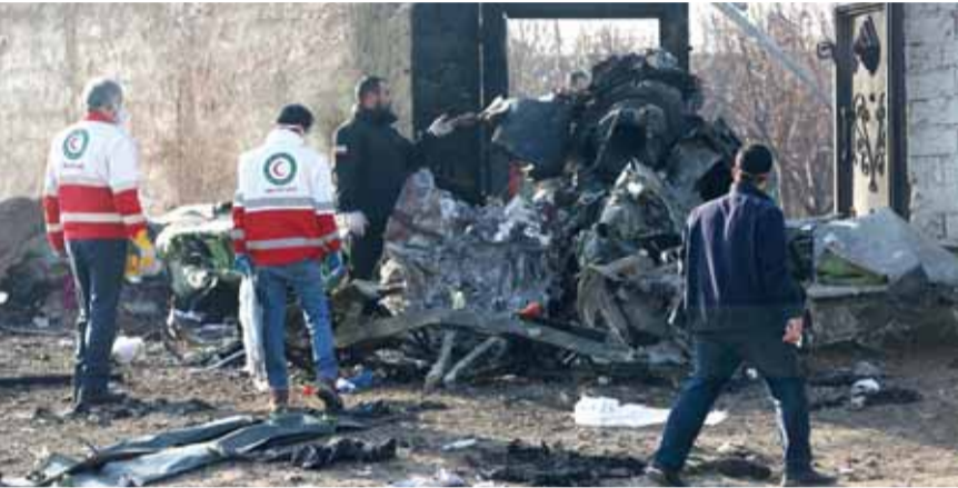
(تفاصيل الطائرة المنكوبة في اسفل الصفحة)

واضع ايران اقتصاديا وهبوط اقتصادها تحت الصفر وعندها قد ينتفض الشعب الإيراني على النظام ويعمل على تغييره. اما في ايران المؤلفة من ٩٠ مليون نسمة ٩٠٪ منهم شيعة فقد اشتعلوا في مظاهرات حزن ووداع للقائد الشهيد قاسم سليماني وودعه بشكل لا مثيل له الاقلة في التاريخ ويبدو ان الإيرانيين بدأوا يدخلون الى العراق من خلال وحدات مجاهدة صغيرة وهي تحمل صواريخ ساغر-اس الروسية المضادة (تتمة المناشيت ص ١٢)