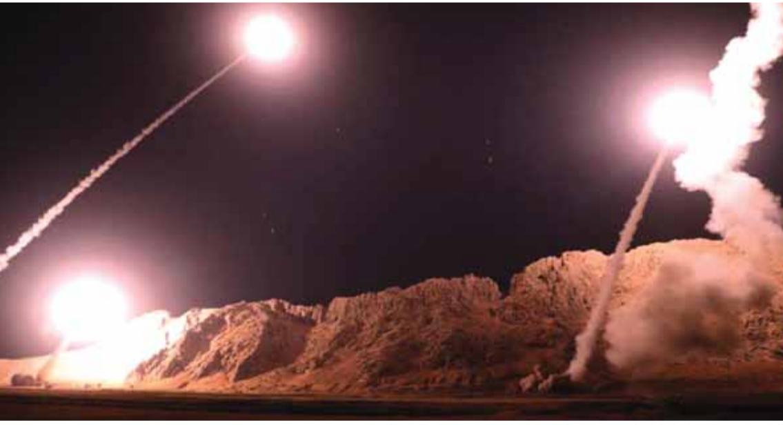
الصواريخ الإيرانية التي استهدفت قاعدة عين الأسد الأميركية في العراق

قال المرشد الإيراني السيد علي خامنئي إن الرد العسكري خطوة مهمة وضرورية ولكن الأهم هو أن ينتهي الحضور العسكري الأميركي في المنطقة. وذكر خلال لقائه حشوداً من مدينة قم، أن «الرد العسكري الذي تم كان مجرد صفعة وهو ليس بحجم الجريمة والرد الأساسي هو خروجهم من المنطقة». ويأتي كلام خامنئي بعد ساعات من تبني حرس الثورة الإيرانية إطلاق عشرات الصواريخ «أرض أرض» على قاعدة عين الأسد (التتمة ص ١١)