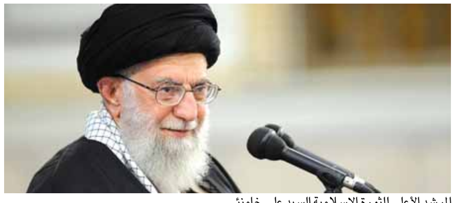
المرشد الأعلى للثورة الإسلامية السيد علي خامنئي

أكد المرشد الأعلى للثورة الإسلامية علي خامنئي، أن الشعب الإيراني «تمكن من القضاء على مؤامرة خطيرة للغاية ضد الجمهورية الإسلامية الإيرانية». وأكد خامنئي تمكن الشعب الإيراني من القضاء على «مؤامرة واسعة وخطيرة للغاية تم التمويل