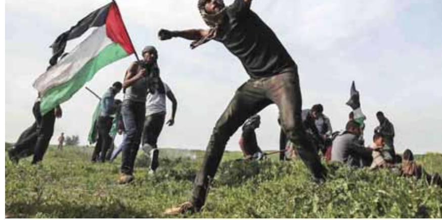
خلال الإشتباكات بين الفلسطينيين وقوات الاحتلال الاسرائيلي

وأفادت وسائل إعلام إسرائيلية نقلاً عن مصادر دبلوماسية وسياسية تأكيدها، أن الإجراء جاء تلبية لطلب قدمته إلى رئيس الوزراء بنيامين نتنياهو عائلة الجندي الإسرائيلي القتل هدار غولدين الذي لا يزال جثمانه محتجزاً لدى حركة «حماس»، إلا أن مصدر صحيفة «تايمز أوف إسرائيل»، لوح بأن جثامين منفذي العمليات قد تستخدم