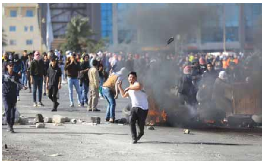
شباب فلسطيني يرمي قوات الاحتلال بالحجارة

أصدر وزير الدفاع الإسرائيلي الجديد نفتالي بينيت امس أمراً يقضي بوقف تسليم جثامين منفذي العمليات الفلسطينيين إلى ذويهم. وذكر مكتب وزير الدفاع في بيان له، أن بينيت أوعز للجيش والدوائر الأمنية بالاستعداد لتغيير سياسة تل أبيب في هذا الشأن، والذي سيتمثل بوقف تسليم جثامين منفذي العمليات إلى عوائلهم بغض النظر عن انتمائهم الفصائلي وطبيعة الهجمات التي نفذوها أو حاولوا تنفيذها. وأضاف أنه سينظر في حالات استثنائية حينما تعود الجثامين لقاشرين. وقال البيان إن هذه الخطوة جاءت بغية منع تنظيم مراسم تشييع شعبية لمنفذي العمليات. وتحتاج هذه السياسة الجديدة إلى المصادقة من قبل المجلس الوزاري المصغر للشؤون السياسية والأمنية (الكابينت).