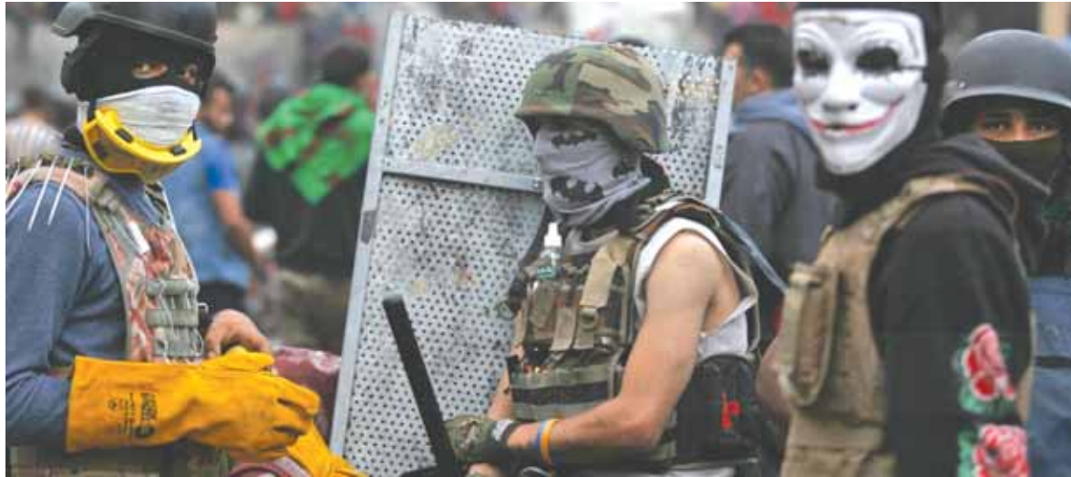
خلال الإشتباكات في العراق

ورئيس الوزراء العراقي عادل عبد المهدي، أهمية فرض النظام في العراق في ظل الإحتجاجات الدائرة ضد الحكومة، فضلاً عن أهمية تعاون البلدين في مكافحة الإرهاب. وجاء في بيان مكتب رئيس الوزراء العراقي أن الأخير تلقى اتصالاً هاتفياً من الرئيس التركي، امس، أعرب فيه أردوغان عن «دعمه لجهود الحكومة في الاستجابة لمطالب المتظاهرين»، وأشاد أردوغان بـ «الحكمة والصبر في أسلوب الحكومة في التعامل مع هذه الأحداث»، مؤكداً «أهمية فرض النظام والقانون والاستماع لمطالب الشعب العراقي»، وذلك بحسب قناة «السومرية نيوز».