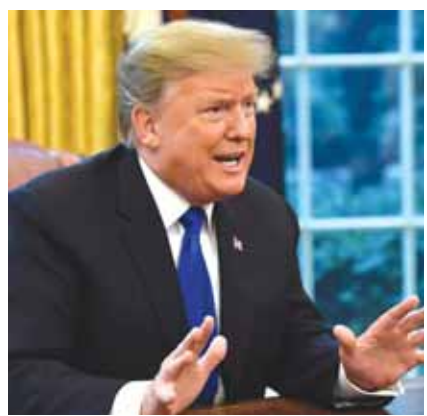
الرئيس الاميركي ترامب

تستعد لجنة الاستخبارات في مجلس النواب الأميركي لتسليم مقاليد تحقيق العزل الجاري بحق الرئيس دونالد ترامب إلى اللجنة القضائية، مع دخول التحقيق مرحلة جديدة. وتوشك على النهاية مرحلة تقصي الحقائق ضمن إطار التحقيق، والتي أشرفت عليها لجنة الاستخبارات، وأعلن رئيس اللجنة آدم شيف الثلاثاء أن تقريراً يضم استنتاجاتها سيصدر الأسبوع المقبل، عقب عودة المشرعين من إجازة عيد الشكر في الثالث من كانون الأول. من جانبها، حددت اللجنة القضائية الرابع من كانون الاول موعداً لأول جلسة لها في القضية التي ستجمع خبراء قانونيين سيدرسون مسائل دستورية، ضمن إطار بحث اللجنة فيما إذا كان يتعين إطلاق عملية العزل بحق ترامب وما هي لائحة الاتهامات الواجب توجيهها إليه. ووجه رئيس اللجنة القضائية جيرولد نادر إلى ترامب ومحاميه دعوة لحضور