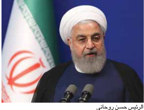
الرئيس حسن روحاني

قال الرئيس الإيراني، الشيخ حسن روحاني، إن طهران ستواصل وتيرة تقليص التعهدات في الاتفاق النووي إذا لم يتم التوصل إلى نتيجة في نهاية المهلة الثانية. وأكد روحاني أن إيران ستبدأ بالمرحلة الثالثة بكل تأكيد وستمنحهم (أطراف الاتفاق الأخرى) فرصة ستين يوما أيضا. وأضاف أن الولايات المتحدة انسحبت بشكل أحادي من الاتفاق النووي، وهذا الأمر وصمة عار تاريخية على جبينها، ولا يعتبر هذا