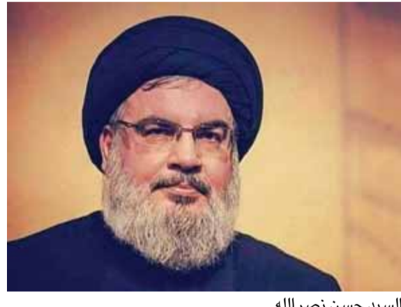
السيد حسن نصرالله

أبرق الأمين العام لـ«حزب الله» السيد حسن نصرالله برقية الى وزير الخارجية الإيرانية الدكتور محمد جواد ظريف، وزعت نصها العلاقات الاعلامية في الحزب، وجاء فيها: «عندما أعلنت الإدارة الأميركية فرض عقوبات عليكم شخصيا، وضمنكم الى لائحة الشرف، قررت انا واخواني ان نرسل لكم برقية نعبر فيها عن تضامننا واحترامنا، الا انني فضلت أن