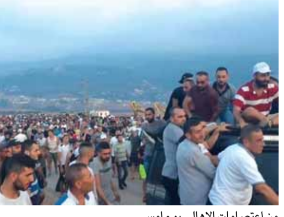
من اعتصامات الاهالي يوم امس

السؤال الذي يطرح دائما ولا جواب له، لماذا الدولة تقف دائما عاجزة امام الأزمات التي تستهدف حياة المواطنين وصحتهم؟ وهل فعلا لا تستطيع إيجاد الحلول لهذه الأزمات وأخرها أزمة النفايات في الشمال؟ ولماذا تعجز وزارة البيئة عن إيجاد حل منطقي وجذري لهذه الأزمة التي تتفاقم يوما بعد يوم، إذ تتراكم النفايات على الطرقات والساحات العامة في أفضية زغرنا والضنية والمنية وبشري وباتت تهدد البيئة والصحة العامة بخطر التلوث حيث بات معلوما تراكم النفايات في ظل