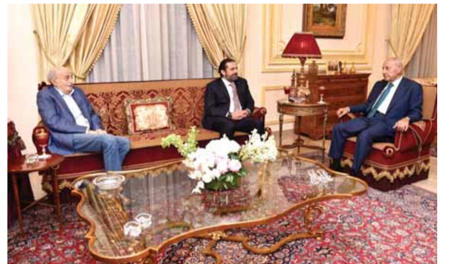
بري مستقبلاً الحريري وجنبلاط