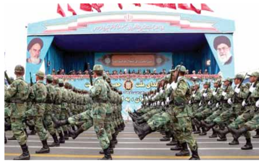
عرض عسكري للحرس الثوري