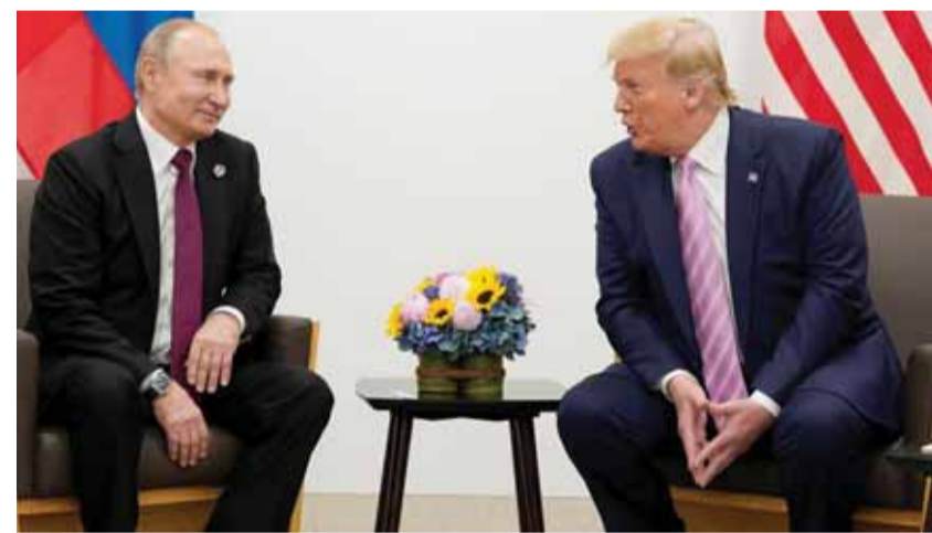
الرئيسان ترامب وبوتين في قمة العشرين

أشاد الرئيس الأميركي دونالد ترامب بدعلاقاته الجيدة جدا» مع نظيره الروسي فلاديمير بوتين عند بدء محادثات ثنائية بينهما على هامش قمة مجموعة العشرين المنعقدة في أوساكا باليابان. وقال ترامب «إنه شرف كبير لي أن أكون مع الرئيس بوتين»، مضيفاً «علاقتنا جيدة جداً»، علماً أن آخر محادثات ثنائية بينهما جرت في تموز ٢٠١٨ في هلسنكي. ويطلق على اللقاء الذي كان مرتقياً بشدة بين الرئيسين التحقيق في علاقات ترامب مع روسيا والجدل الذي تلا محادثاته الأخيرة مع سيد الكرملين. وطغى على سؤال وجهه إليه صحفيون في البيت الأبيض حول فحوى محادثاته المقررة مع بوتين قبيل توجهه الى اليابان قال ترامب «لا شأن لكم».