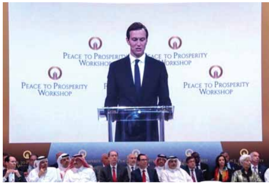
كوشنير يتحدث في مؤتمر المنامة

الأميركية والإسرائيلية التي خصصت صفحاتها عن صفقة القرن، قالت ان هذه الصفقة لا يقاس عمرها بأسبوع او بأسبوعين بل هي ستمتد على مدى ٣ سنوات و٤ سنوات، وان ما أعلنه صهر الرئيس الأميركي ترامب السيد جاريد كوشنير ومستشار الرئيس الأميركي ترامب للشؤون السياسية، هو بداية لعملية ستستمر ٣ و٤ سنوات، وان لمشكلة أساسية مع مصر، في شأن توسيع المنطقة الصناعية قرب غزة لإيجاد فرص عمل لسكان غزة والشباب فيها والصابايا، إضافة الى إقامة مطار في المنطقة الممتدة بين رفح العريش مع إقامة مرفأ كبير سيؤدي الى إقامة فرص عمل للفلسطينيين. لكن ذكرت هذه الصحف ان الأرض ستبقى مصرية لان مصر قالت انها لن