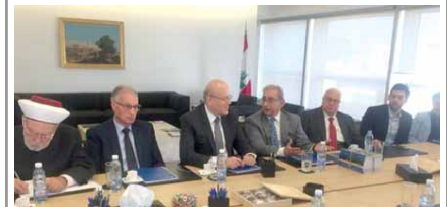
الرئيس ميقاتي مع زواره