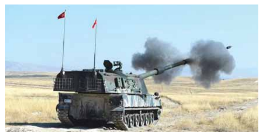
مدفعية الجيش التركي تقصف المواقع السورية

أعلن التلفزيون العربي السوري، أن وحدات من الجيش ردت امس، على مصدر قذائف القوات التركية التي استهدفت مواقع تابعة للجيش في شمال البلاد. وقال التلفزيون السوري، إن أكثر من ١٨ قذيفة صاروخية مصدرها القوات التركية في شير مغاور وريف ادلب الجنوبي استهدفت قرى الكحريم وقبر فضة وأطراف بلدة الحوزين في الغاب في ريف حماة الشمالي... وقوات الجيش ردت على مصدرها». إلى ذلك أعلنت الدفاع التركية عن قصف مواقع تابعة للجيش السوري، ردا على ما سمته بـ «اعتداء» على نقطة مراقبة في ادلب شمال سوريا، أسفر عن مقتل أحد العسكريين الأتراك وإصابة ٣ آخرين، متهمه سلطات البلاد بالوقوف وراء الحادث.