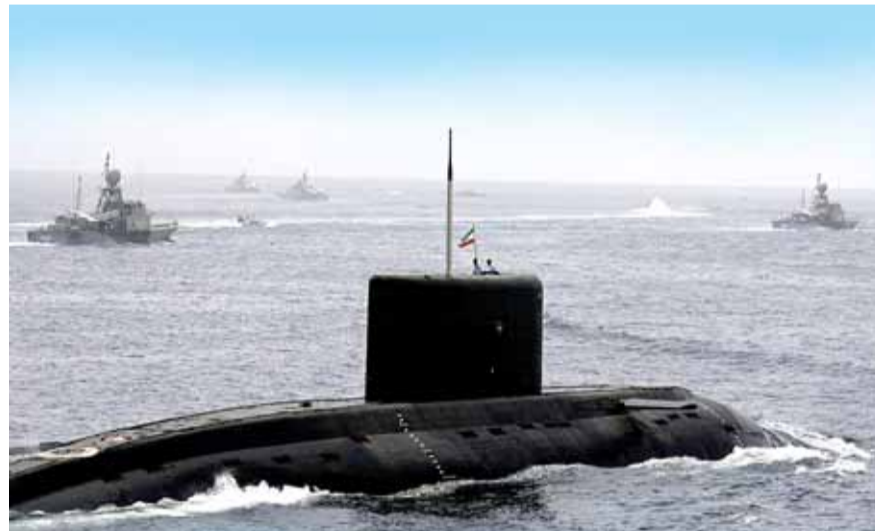
بوارج في بحر الخليج

اعلنت وزارة الدفاع الاميركية ليلان هدف الحشود الاميركية في الخليج ردع ايران وليس الحرب معها، الى ذلك قالت صحيفة «وول ستريت جورنال» الاميركية ان الرئيس دونالد ترامب لا يسعى الى خوض حرب مع ايران بقدر رغبته في الضغط عليها من أجل التوصل إلى اتفاق في عدة ملفات، مشيراً إلى أن مستشاري ترامب يحاولون أن يضغطوا من جانبهم على الرئيس للوصول إلى مرحلة المواجهة.