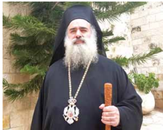
المطران عطالله حنا

وصل الى المدينة المقدسة وقد برلماني هولندي حيث رافقهم سيادة المطران عطا الله حنا رئيس اساقفة سبسطية للروم الارثوذكس في جولة داخل البلدة القديمة من القدس ومن ثم التقى بهم في الكاتدرائية مرحبا بزيارتهم وشاكر اياهم على مواقفهم الانسانية وتضامهم مع شعبنا الفلسطيني في