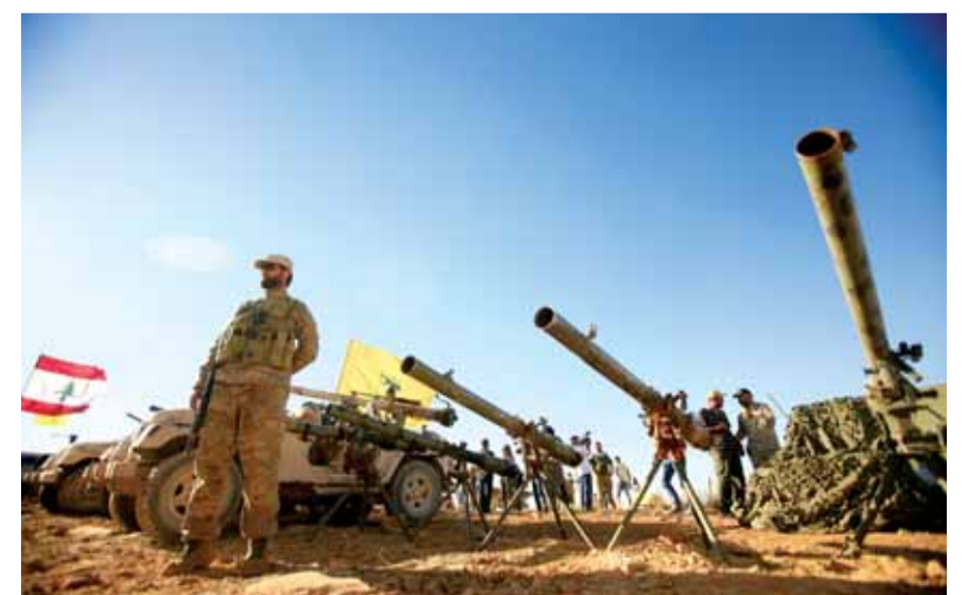
صواريخ حزب الله

نشرت صحيفة «واشنطن بوست» الأميركية مقالاً حول الحرب الأميركية مع إيران، والتي حذر من خطورتها وحجمها الكاتب ماكس بوت، وهو باحث بارز في مجلس العلاقات الخارجية ومؤلف كتاب «جيوش غير مرئية: ملحمة التاريخ من حرب العصابات في العصور القديمة إلى